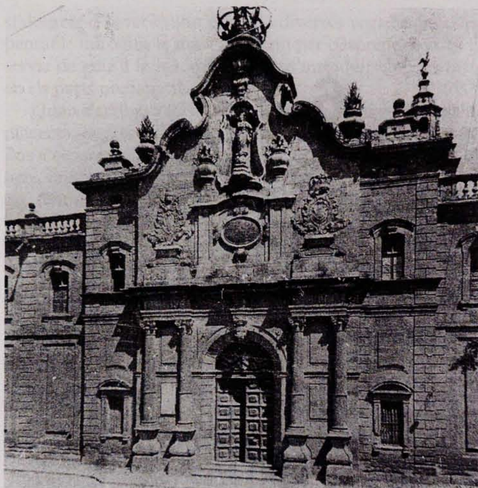
FIG. 18. Façana principal de la Universitat de Cervera.

es tractava de cap plaça d'armes. Allí, en una primera fase, es van traslladar les Facultats de Teologia, Cànon i Filosofia. La Facultat de Medicina va romandre en un principi a Barcelona, situada a l'Hospital de la Santa Creu, ja que els seus professors eren els millors metges de la ciutat; després, però, va passar també a Cervera (fig. 18).