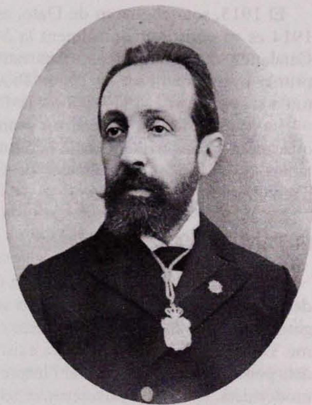
FIG. 21. DR. BARTOMEU ROBERT. Va fundar, juntament amb FERRER I VIDAL i PRAT DE LA RIBA, el partit de la Lliga Catalana.

Des d'un punt de vista científic va triomfar l'acceptació de les idees de CLAUDE BERNARD. Es va crear una ciència experimental i es va deixar de banda l'empirisme.